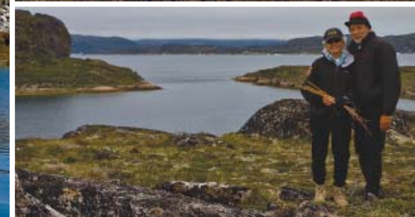
Plovidba do Irske bila je izrazito teška, toliko da su se Dashewovi morali vezivati za krevete, ali su zato sve nadoknadili uživajući u njezinim prelijepim krajobrazima

suzno za brod od 25 metara koji bi u svakoj drugoj izvedbi imao najmanje 5 kabina i ku-paonica.